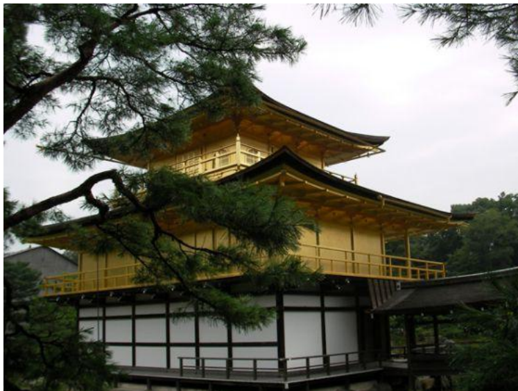
Храм Кинкакудзи (Япония)

Но всё - же, внутренняя сущность и сложное символическое значение композиции восточного сада была оставлена без внимания европейцами. Элементы «пейзажного» мышления восточного сада, проникая в Европу, преображались и изменялись почти до неузнаваемости. Сначала идея пейзажного парка обозначалась как англо-китайский парк, затем просто – английский парк. Если в восточном саду «гора» и «вода» - два первоначала, то в европейском парке идеи вечного и преходящего выражались в виде различных