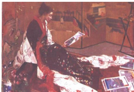
Уистлер. Каприз в пурпурном и золотом: Золотая ширма, 1864г.

В творчестве Хокусаё ярко проявился синтез самобытной кистевой техники восточной живописи и европейской реалистичности на самом высоком уровне духовного проявления