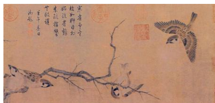
Цуй Бо. Зимние синицы. 10-12 век. Шёлк, тушь, краски. Фрагмент свитка

В 1644 году в Китае рухнула династия Мин и очень многие учёные, и художники приехали в Японию, способствуя тем самым распространению полученных знаний от иезуитов. Японские художники познакомились с приёмами европейской живописи: правдивостью и конкретностью в передаче натуры.